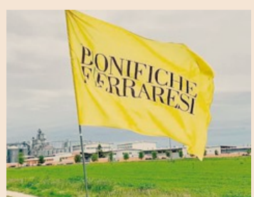
BF. Primo in Italia nell'agroindustria